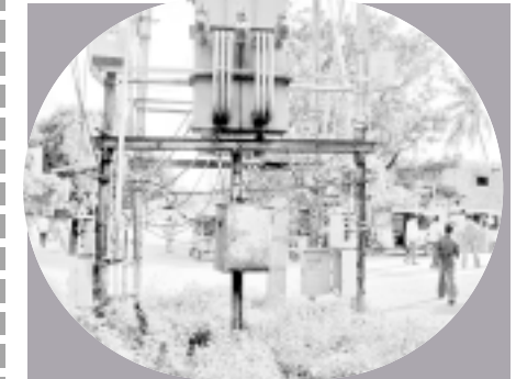
వ్యాల్వెస్ రోడ్డులోని ట్రాన్స్మిషన్ టవర్