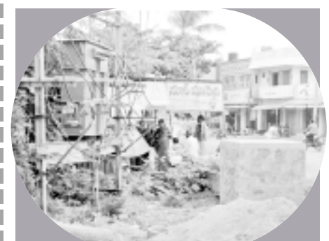
కణేకల్లులో కంచెలెని ట్రాన్స్మిషన్ టవర్