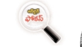
నియోజకవర్గంలో విద్యుత్ శాఖ నిర్లక్ష్యం స్పష్టంగా కనిపిస్తోంది. జననంచారం వున్న ప్రాంతంలో బిగించిన ట్రాన్స్మిషన్ టవర్లు నిత్యం ప్రమాదాలను సూచిస్తున్నాయి. పాదచారులు, వాహనచోదకులు, ధ్యాన లేకుండా వేళుతున్నప్పుడు అనుకోకుండా ట్రాన్స్మిషన్ టవర్ల డి కౌట్ల మృత్యువాత పడేంత ప్రమాదకరం సరికెలాలు అందిస్తున్నాయి. నిత్యం ప్రజలు వుండే ప్రాంతాల్లో కూడా ట్రాన్స్మిషన్ టవర్లకు ఎలాంటి కంచె ఏర్పాటు చేయకపోవడం ఆందోళన కలిగిస్తుంది. అధికారుల నిర్లక్ష్యానికి పరాకాష్టగా నిలిచిన ట్రాన్స్మిషన్ టవర్లు మనుషుల ప్రాణాలతో చెలగాటం మాడుతున్నాయి. దీనిపై విద్యుత్ శాఖ స్పందించకపోతే ప్రాణనష్టం తప్పని పరిస్థితిని సూచిస్తున్నాయి.