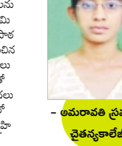
- అమరావతి ప్రవంతి, వైకన్యాకాలిణి

మా అమ్మవాళ్ళది గ్రామీణ ప్రాంతం. అమ్మకు ధైవ భక్తి చాలా ఎక్కువ. అక్కడ కృష్ణాష్టమి నాడు చిన్న పిల్లలందరితో బాలకృష్ణుల వేషం వేయించి వీధుల్లో కోలాహలంగా భజనలు.. కోలాహలం తిరుగుతూ ఉంటే మాడటానికి మనోహరంగా ఉంటుంది. బాలవిశాన్ కార్యక్రమాల్లో నా తమ్ముడి చేత కృష్ణుని వేషం వేయించి, నామ్మ చేసిన జ్ఞాపకం తలచుకుంటే హాయిగా ఉంటుంది. పండుగనాడు రాత్రి మేము వెన్నెలలో స్వామికి నైవేద్యంగా పెట్టిన ప్రసాదం అందరితో కలిసి సరదాగా తింటాం.