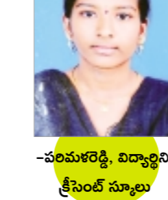
- పరివారశ్రీ, విద్యార్థిని, క్రీసెంట్ స్కూలు

చాలామందికి పండుగలు మధుర జ్ఞాపకాలను అందిస్తాయి. అలాగే నాడు శ్రీకృష్ణ జనాష్టమి అంటే చాలా ఇష్టం. ఆ రోజు మా ఇంట్లో, పాఠశాలలో తెలుగు టీచర్ల కృష్ణుడికి సంబంధించిన పక్కని కథలు చెబుతారు. నా స్నేహితురాలి భవ్య ఇంట్లో చిన్నికృష్ణుడి పాదముద్రలతో ఇల్లంతా నడిపిస్తారు. వెన్నపూసిన ఆ ముద్రలు ముచ్చటగా ఉంటాయి. మొత్తమ్మీద ఆ రోజు జంతా ఆనందంగా గడిపేందుకు మా స్నేహితులలా బాగా సహకరిస్తారు.