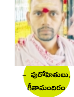
- పురోహితులు, గీతామందిరం

శ్రీకృష్ణ వైకన్యాస్మి అనుసరించే వారికి కృష్ణానుగ్రహం కలుగుతుంది. భౌతిక సంపదలు, సౌఖ్యాలు అడగకుండానే లభిస్తాయి. దేవుని వద్ద కూడా బేరసారాలు మంచివి కావు. తన సేవలో నిమగ్నుడైన వారి అవసరాలను తానే తీరుస్తానని సాక్షాత్తు భగవంతుడి సలహాచిచ్చాడు. అందుకే అనుగ్రహం కోసం శ్రీకృష్ణుడు చూపిన బాలలో నడిచి తరించాలి. కేవలం పండుగనాడే కాకుండా సదా కృష్ణాను సంగీర్తనలో జీవితం పాపం చేసుకుందాం.