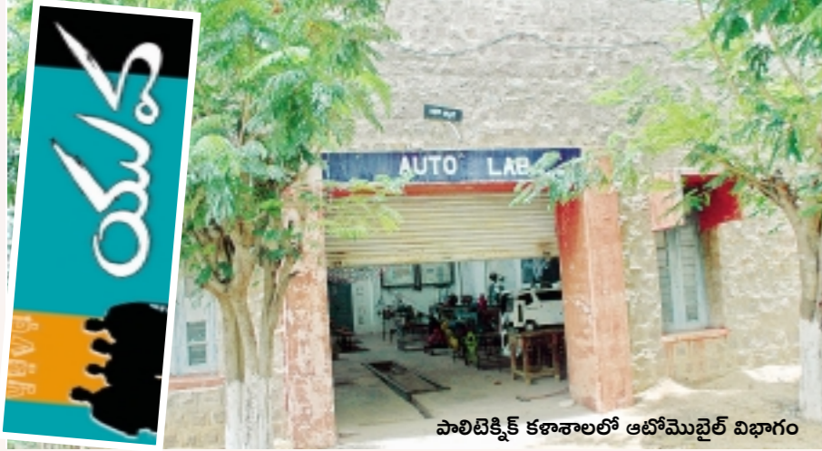
పాలిటెక్నిక్ కళాశాలలో ఆటోమొబైల్ విభాగం

'అనంత' పాలిటెక్నిక్ విద్యార్థుల ఉత్సాహం ప్రోత్సాహం కోసం ఎదురుచూపులు